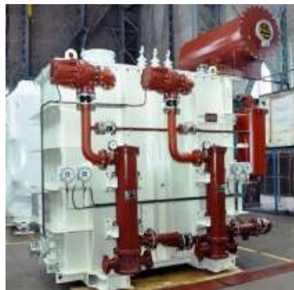
ЭТЦПК-7500/10 для ДСП