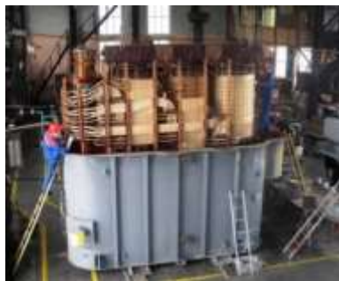
Ремонт (установка активной части в бак трансформатора ТРДЦН – 1600000/220)