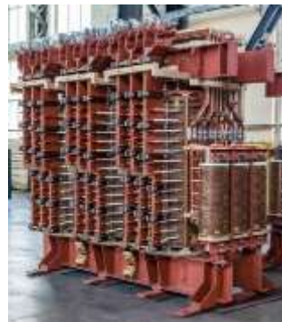
Активная часть ЭТЦНКИ-12500/10