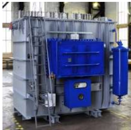
ЭТЦНВР-31500/10 для РТП