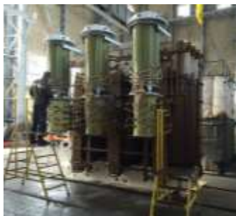
Модернизация (ТМУ-41/35 кВ, номинальная мощность 80000 кВА)