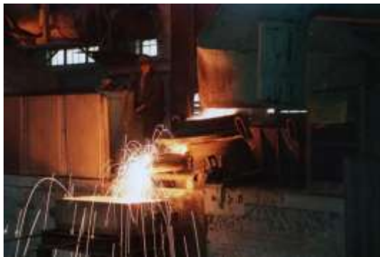
Плавка ферротитана в индукционных печах на ОАО «Корпорация ВСМПО-АВИСМА»

Главной особенностью трансформаторов для индукционных электропечей является большая глубина регулирования вторичного напряжения ( \Gamma > 6 ). Другой особенностью является необходимость постоянной мощности на нескольких ступенях НН, что повышает типовую мощность и массу ЭПТ. Наконец, технологические особенности плавки требуют регулирования вторичного напряжения 11-23 ступенями.