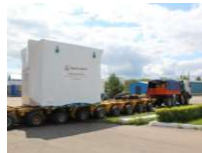
Отгрузка трансформатора ТМУ-41/35 кВ после модернизации (замена ПУ)