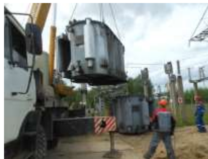
Поднятие колокола трансформатора