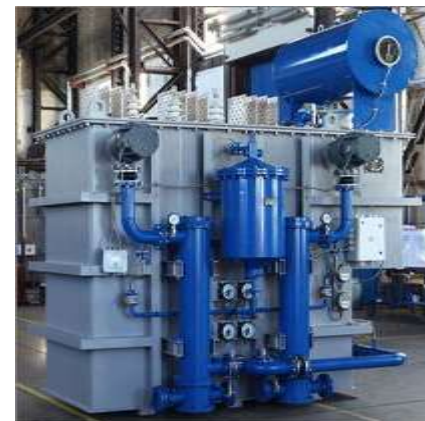
ЭТЦНКИ-12500/10 для ИП