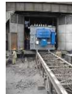
Монтаж нового трансформатора