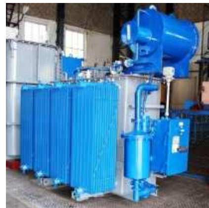
ЭОМНШ-2500/10 для ЭШП